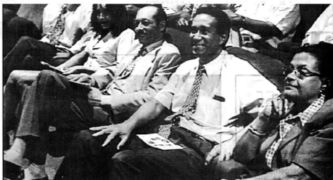
Lors de la présentation de son film au Circuit Élizé.

Sans trop forcer les mots, on peut dire qu'il s'agit là d'une œuvre d'utilité publique, ce qui explique les aides de certaines institutions comme les Conseils Général et Régional, la ville de